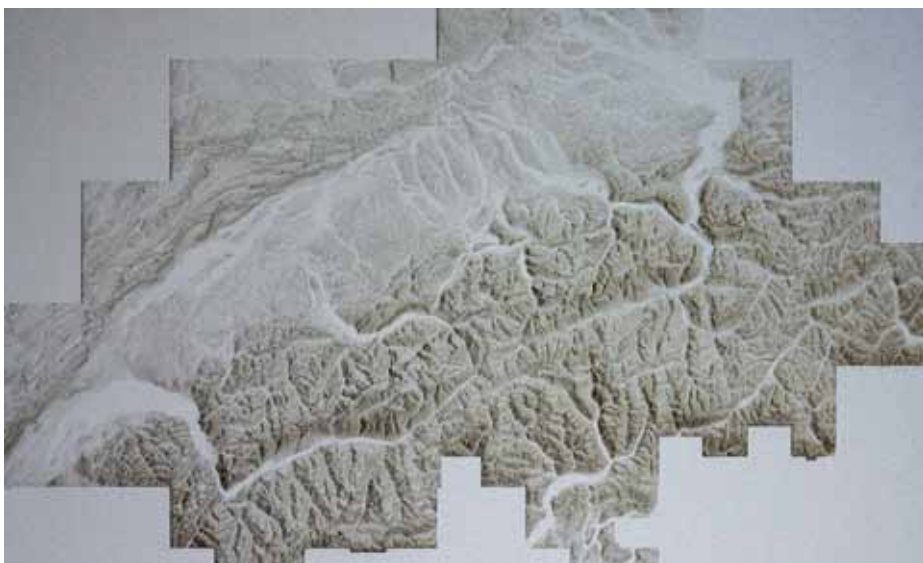
▲ Abb. 3: Topographie der Schweiz, Maße 108 x 65 mm (B. Neuenschwander / B. Jäggi / M. Zimmerman – gefördert im FP7 Projekt APPOLO).

Rasterdarstellung erzeugt werden, die mit den Laserpuls-Überlagerungen übereinstimmt. Für eine vollständige Ausschöpfung der Potenziale der Polygon-Technologie muss daher ein besonderes Augenmerk auf die Einrichtung und Übernahme der Eingangsdaten gerichtet werden.